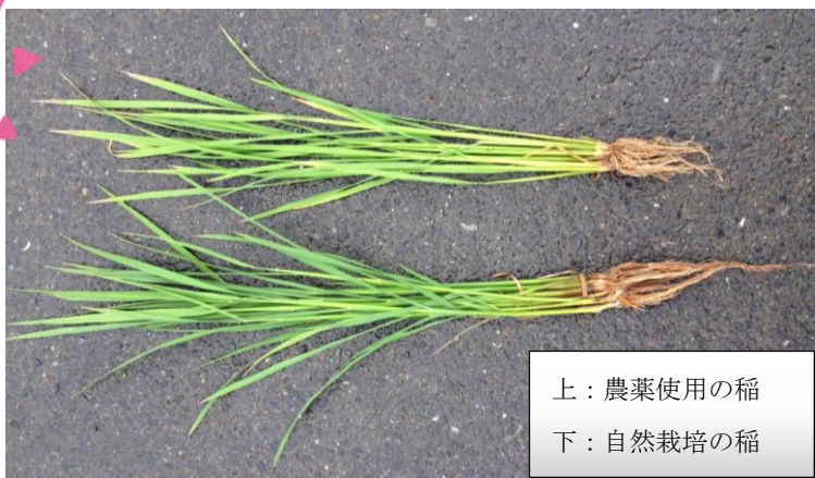
上：農薬使用の稲 下：自然栽培の稲